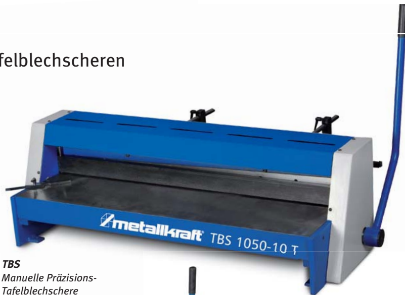
TBS Manuelle Präzisions- Tafelblechscherer