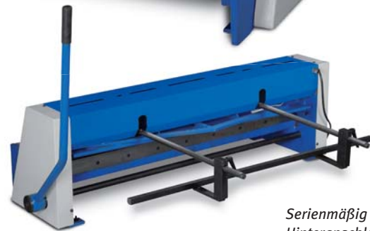
Serienmäßig mit Hinteranschlag 500 mm