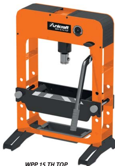
WPP 15 TH TOP