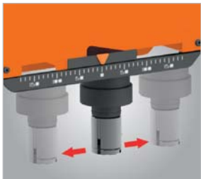
Seitlich verfahrbarer Zylinder mit Skalanzeige bei allen Standmodellen