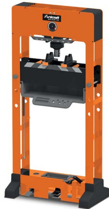
WPP 50 BPF TOP