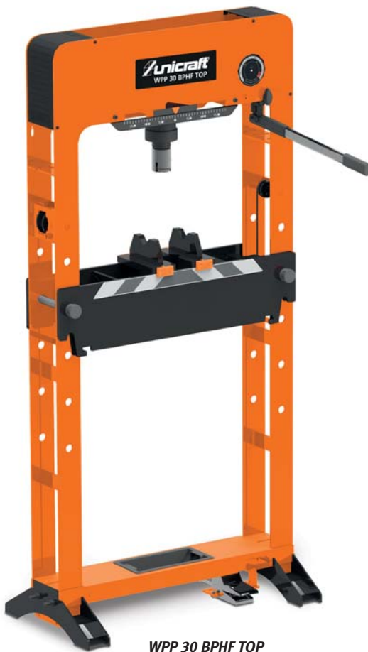
WPP 30 BPHF TOP