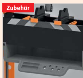
Großes herausnehmbares Ablagefach am Pressentisch