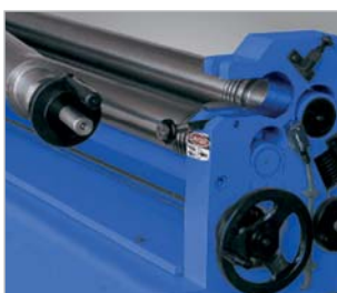
Abbildung zeigt Maschine mit Optionen Digitalanzeige für Seitenwalze und motorische Zustellung der Seitenwalze