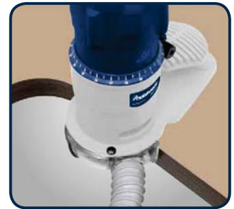
Abb. zeigt Anwendungsbeispiel