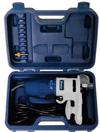
Abb. zeigt Lieferumfang