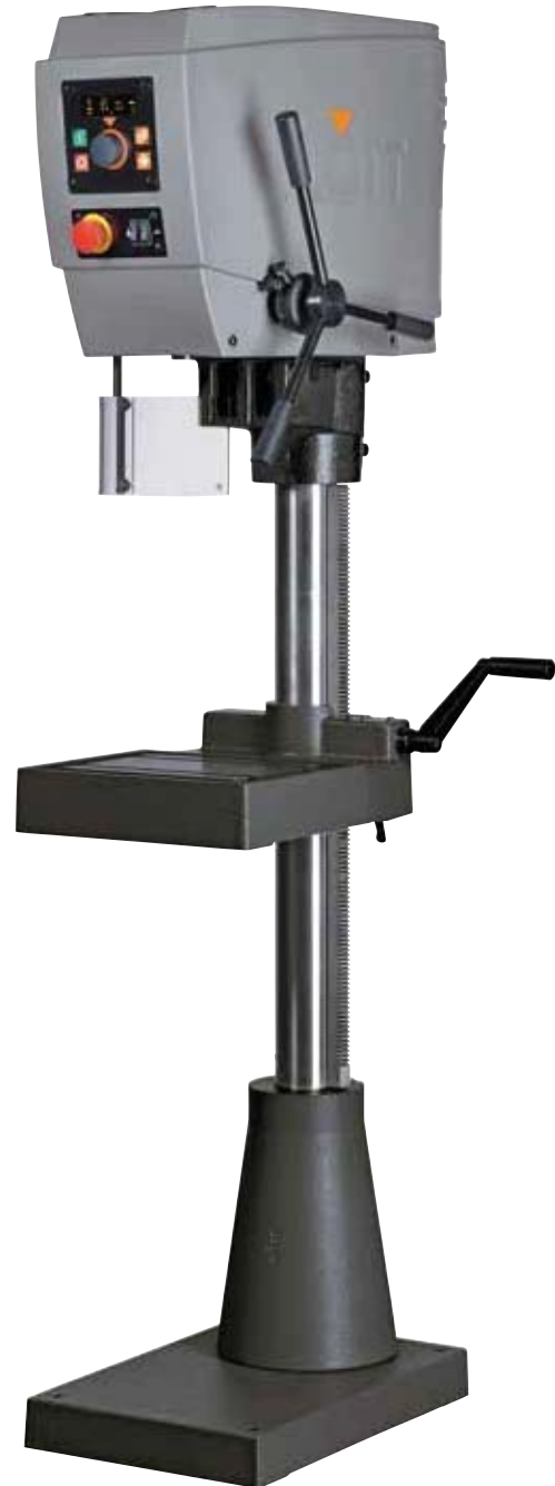
Abb.: SB 20 ▶ Plus mit Sonderausstattung