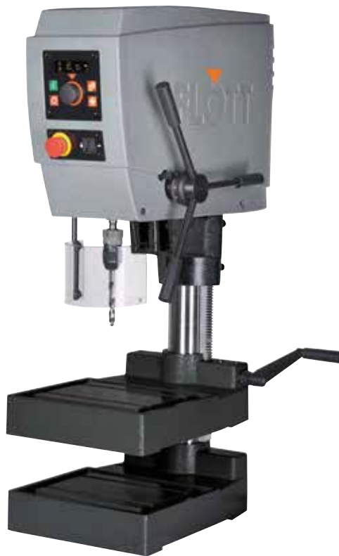
Abb.: TB 20 ▶ Plus mit Sonderausstattung